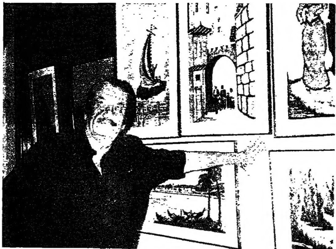
الرسم وعمله ابن الكلبوس والتجربة جمال ماريني : مجموعة في محيط واحد